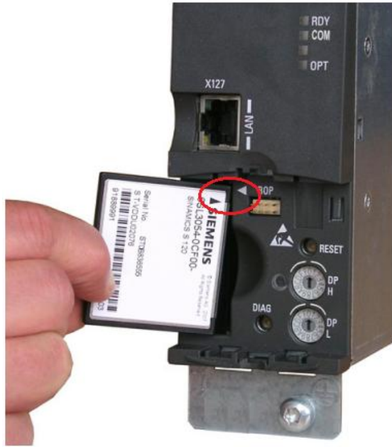
图 1-1 S120 的 CF 卡

CF 卡是 SINAMICS S120 的控制单元 (CU) 工作时必需的存储设备, 其中保存了固件 (Firmware)、用户数据、授权等信息, 在断电情况下数据也能够永久保存。STARTER 软件中的“Copy RAM to ROM”操作即将数据存储存储在 CF 卡上。在 CF 卡的标签上包含了固件版本、序列号等基本信息。如图 1-1 所示, 注意在插拔 CF 卡的时候必须关掉电源并将卡上的箭头和设备上箭头对齐。